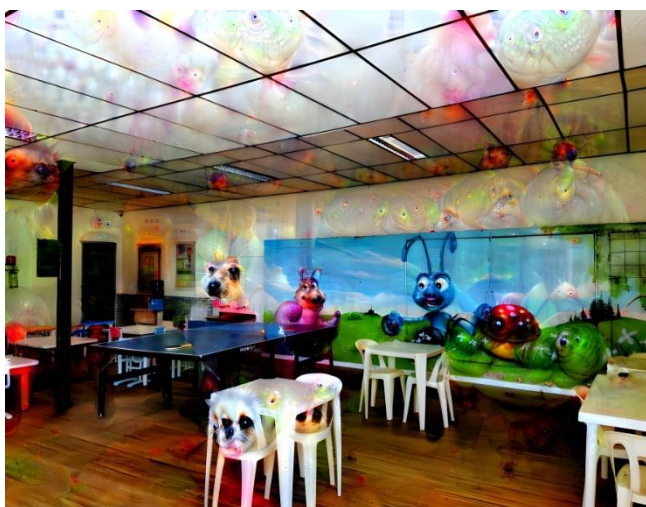
Figura 1 – Pátio do colégio (NFTs)